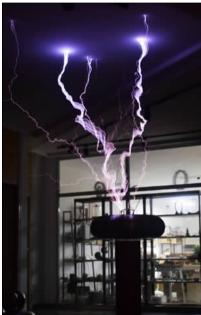
人造闪电