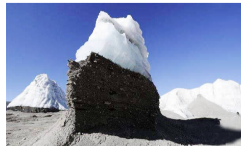
西藏那曲双湖县普若岗日冰川正在消退